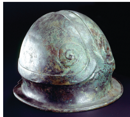
Čelada z okrasnimi volutama in palmeto.

Trgovino so v času železne dobe nadzorovali premožni sloji. Da so ostali v prijateljskih odnosih in je trgovanje potekalo nemoteno, so si med seboj podarjali najrazličnejše dragocene predmete, na primer luksuzno posodje, orožje, nakit, včasih celo 6 .