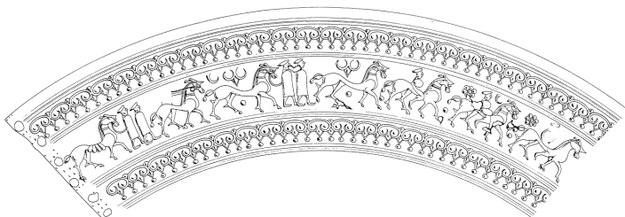
Tovorjenje mehov s konjem, Novo Mesto, Kandija. Risba: arhiv Dolenjskega muzeja Novo mesto.

O trgovini v času železne dobe nimamo zanesljivih podatkov, gotovo pa je, da so kovaške, steklarske, kovinske in verjetno tudi druge izdelke izdelovali ne le za domačo rabo, temveč tudi za trgovanje. Na podlagi odkritih predmetov tega časa lahko arheologi ugotavljajo, s katerimi predeli takratnega sveta so imeli železnodobni prebivalci z območja današnje Slovenije tesne stike. Večina uvoženih predmetov je bila prestižnih, zato so bili pridani le v grobove 19 10 1 4 članov skupnosti. Trgovali pa so tudi z bolj vsakdanjimi stvarmi, na primer z železom, konji in drugo živino, živopisanimi ogrlicami in tkaninami, ki so jih zamenjevali za vino iz Sredozemlja in za kameno sol, ki je prihajala predvsem z območja današnje Avstrije.