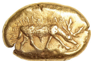
Sprednja stran grškega staterja iz elektrona, kovana med 7. st. pr. Kr. V kovnici Elez.

današnjem pomenu besede govorimo takrat, ko kovni gospod s pečatom jamči za težo in kvaliteto kovine novca, torej za njegovo vrednost.