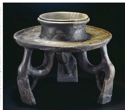
Trinožnik, izdelan po italjskih vzorih.

Preko današnje Slovenije so že v prazgodovini potekale pomembne 12 10 13 6 poti, po katerih so se z menjavo dobrin širili tudi različni kulturni vplivi. Prav preko naših krajev so namreč potekale najugodnejše poti, ki so povezovala Podonavje in Italijo ter Jadran in srednjo Evropo. Posledica teh stikov je bil tudi prenos znanja o pridobivanju železa na območje današnje Slovenije in uveljavitev železarstva v starejši železni dobi, ki je postalo ena izmed glavnih gospodarskih dejavnosti. Vplive, ki so prihajali iz različnih smeri in so se na našem prostoru različno uveljavljali, lahko opazimo na vseh področjih življenja železnodobnega