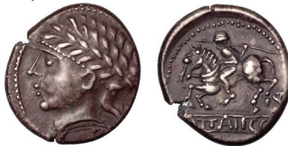
Sprednja in zadnja stran tetradrahme keltskega plemena Norik.

brnike in redko 14 1 4 6 . Zanimivo je, da so mojstri kovali denar kar v potujočih kovnicah. Kovanje lastnega denarja je v vseh zgodovinskih obdobjih in na vseh območjih znamenje politične samostojnosti ljudstev, ki so denar dajala v obtok.