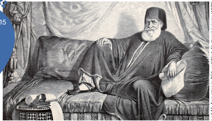
Slika: Mehmed Ali. Aegypten in Bild und Wort, Stuttgart-Leipzig (1879).