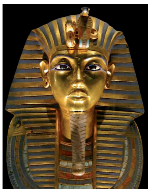
Slika: Tutankamonova maska.

Carter je svoje egiptološko udejstvovanje začel kot prepisovalec in prisovalec starih stenskih napisov. Kasneje je v službi lorda Carnarvona po dolgem in napornem iskanju leta 1922 v Dolini kraljev odkril grobnico faraona Tutankamona, sprva Tutankatona (imenovanega po bogu Atonu, ki so ga ukinili