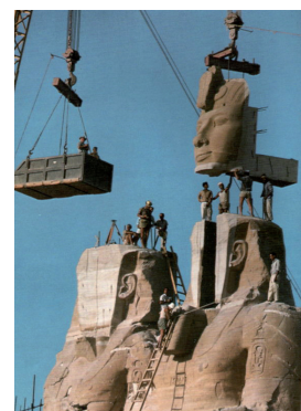
Slika: Abu Simbel. Wikipedia.

zgradi nov jez, ki je pomenil nevarnost popolnega uničenja vseh arheoloških najdišč in spomenikov ob bregovih Nila v zgodovinski pokrajini Nubiji. Pred tako resno in neposredno nevarnostjo je Unesco leta 1960 sprožil mednarodno kampanjo za rešitev najdišč in spomenikov Nubije. Najbolj spektakularna dela te akcije so bila (v letih 1964–1966) razrez dveh skalnih svetišč, zgrajenih v času faraona Ramzesa II. (1279–1212 pr. n. št.) v Abu Simblu, prestavitev na novo lokacijo 65 metrov višje nad sedanjo gladino akumulacijskega jezera (Naserjevo jezero) in ponovna sestavitvev.