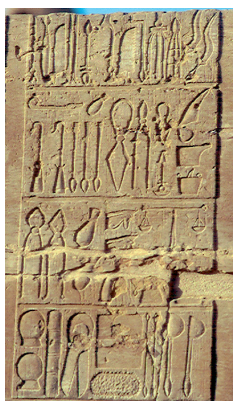
Slika: Staroegipčanski medicinski pripomočki.

Druga izjemno pomembna dejavnost, s katero so se ukvarjali svečeniki, pa je bila medicina. Če je človek zbolel, so verjeli, da so ga obsedli zli duhovi. Poznavanje ter zdravljenje različnih bolezni je bilo sicer na izjemno visoki stopnji. Zdravniki so bolniku določili bolezen in predpisali zdravila.