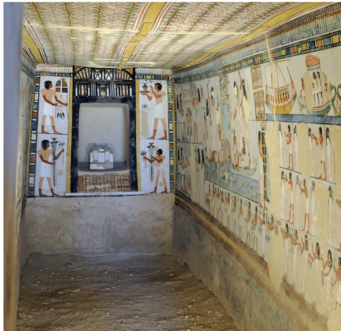
Slika: The Ancient Egypt Site.

Stari Egipčani so bili izjemni slikarji. Njihove slikarije so pogosto krasile 3 13 8 1 14 pokojnikov, palače, templje ... Egipčanske slike so naslikane na način, ki ga imenujemo egipčanski kánon. Pri upodobljenih ljudeh lahko opazimo poseben način slikanja. Osebe so upodabljali s profila, vendar so oči