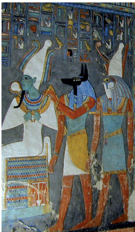
Slika: Oziris, Anubis in Horus. Wikipedia.

Verovali so v več kot 3.000 bogov. Najpomembnejši so bili Oziris, njegova žena Izida in njen sin Hor. Najvišje božanstvo je bil bog sonca, Amon Ra. Verjeli so, da se vsako jutro rodi kot dojenček, zvečer pa postane starec, ki ponoči umre. Vsako božanstvo je bilo povezano z neko živaljo, ki je predstavljala živo podobo boga.