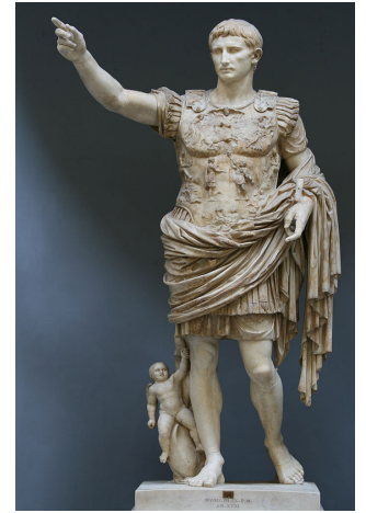
Cesar Avgust, Vatikanski muzeji.