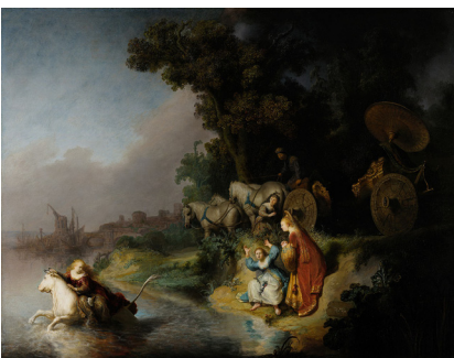
> Ugrabitev Evrope. Sliko je naslikal znani holandski slikar Rembrandt leta 1632.

Od 2. stol. pr. n. št. so Rimljane vedno bolj privlačile grške filozofske ideje, ki so skušale odgovoriti na pomembna življenjska vprašanja. Pri Rimljanih je bil močno razširjen stoicizem, ki je imel grške korenine. Svojo filozofijo so predstavljali kot način življenja, ne zgolj kot teorijo. Svarili so pred pretiranim uživaštvom in poudarjali, da so vsi ljudje, tudi tujci in sužnji, prebivalci istega sveta in je z njimi treba tako tudi ravnati. Verjetno je prav stoicizem pripomogel k izboljšanju življenja sužnjem od 1. stol. naprej.