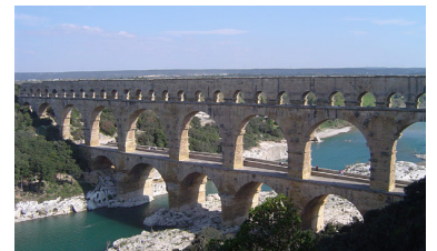
Pont du Gard, Nîmes. Vir: http://en.wikipedia.org .

Med najpomembnejšimi arhitekturnimi tipi, ki so jih prvič uvedli Rimljani, so terme, bazilike, amfiteatri in slavoloki. Uporaba dveh pomembnih novosti, 14