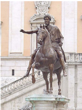
Konjeniški kip Marka Avrelija na Kapitolu v Rimu.

, ki je postalo v 4. stol. državna vera, poganski bogovi pa so bili kmalu povsem potisnjeni v ozadje.