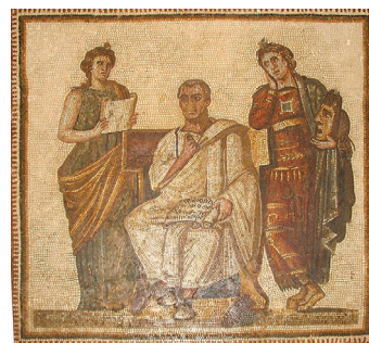
Vergil med muzama Klio (muza zgodovine) in Melpomeno (muza tragedije). Tunizijski mozaik, BarDO Museum.

Izobraženi Rimljani so veliko pisali v grščini. Latinska literatura (zgodbe, pesmi, gledališke igre in drugi teksti, napisani v latinščini) se je začela šele v 3. stol. pr. n. št. Znane rimske avtorje prebiramo še danes: filozofa Cicera, zgodovinarja Tacita, dramatika Plavta in Terencija, pesnike Lukrecija, Katula, Horacija, Tibula, Propercija, Ovidija in Marciala, romanopisca Petronija in Apuleja ter epika Vergila, ki je ustvaril največji rimski ep