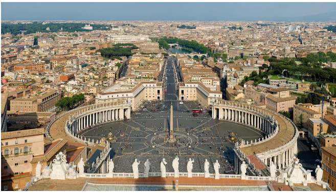
Trg svetega Petra v Rimu. Foto: David Illiff. Licenca: CC-BY-SA 3.0. Vir: http://en.wikipedia.org .