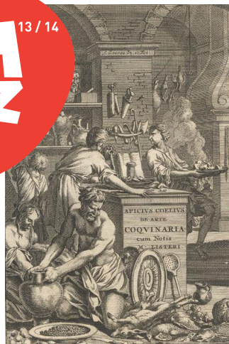
Apicius: O kuhanju. (1709, naslovna stran).

Rimsko družbo so sestavljali različni sloji: izjemno bogati, pa tudi revni in povsem brezpravni prebivalci. Družbeni status je določal vsakdanje življenje ljudi, kaj bo kdo jedel, kaj oblekel in s kom se bo poročil. Svobodno rojeni državljani so se delili v več razredov glede na njihovo premoženje. Nedržavljeni so imeli omejene pravice, 15 8 7 pa so bili brez pravic, popolnoma odvisni od svojih gospodarjev. Danes zelo dobro poznamo vsakdan bogatih prebivalcev, saj je o le-teh nastalo največ zapisov. O nižjih slojih vemo manj.