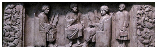
Relief iz Neumagna: Učitelj in trije učenci.

O vsakodnevem življenju Rimljank vemo veliko manj kot o Rimljanih, saj so v tem času večino knjig, iger, zgodb itd. pisali moški. Svobodno rojene ženske so imele manj pravic kot moški. Sprva so bile popolnoma odvisne od svojega očeta, kasneje navadno od moža. Veliko manj pravic so imele pripadnice nižjih slojev. Osvobojenke (nekdanje sužnje) so se lahko poročile le z moškimi iz njihovega razreda (ne iz višjega), sužnje pa pravice do poroke sploh niso imele. Prav tako niso imele pravic do svojih otrok, saj je bila njihova usoda v celoti odvisna od gospodarja. Položaj žensk se je skozi čas spreminjal, ženske v času republike so imele manj pravic kot v obdobju imperija. Kljub temu pa so njihove glavne naloge ostale iste – poročiti se in roditi otroke, skrbeti za dom in gospodinjstvo, kuhati, čistiti, šivati in 16 9 1 16 7 .