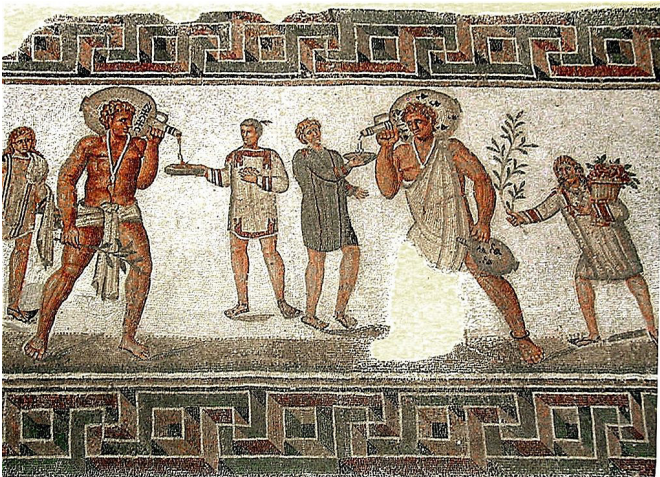
Mozaik iz Dougge. Vir: http://en.wikipedia.org .

arheološke najdbe. Žal o preprostejših bivališčih revnejšega prebivalstva vemo manj, ker so se slabše ohranila. Bogati rimski domovi so imeli notranje stene prekrivane s stenskimi poslikavami – 14 5 15 9 11 7 . Te so bile živih barv in vzorcev. Bile so tako priljubljene, da so jih imeli ljudje tudi v manj premožnih hišah. Tla so bila prekrita z mozaiki. Tudi ti so bili večbarvni in z najrazličnejšo motiviko. Ob bogatemu talnemu in stenskem okrasju pa so imele rimske hiše zelo malo pohištva – mizo, kakšen stol, triklinij, posteljo in skrinjo ali omarico za shranjevanje osebnih predmetov.