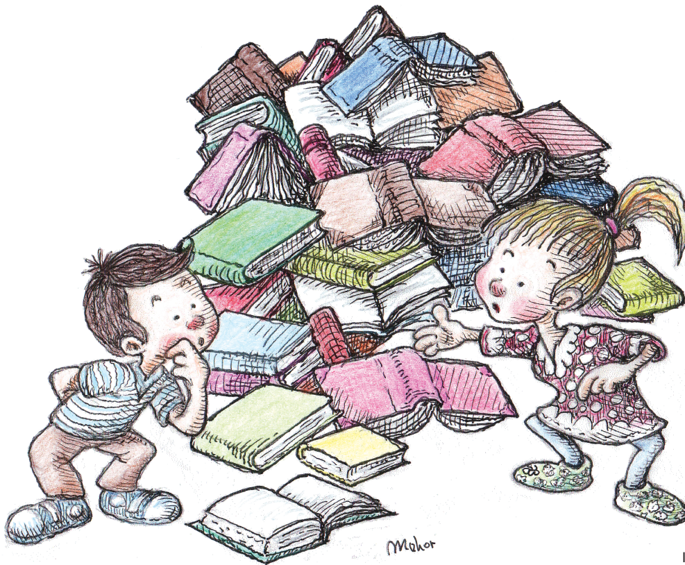
Ilustracija: Miha Mohor.